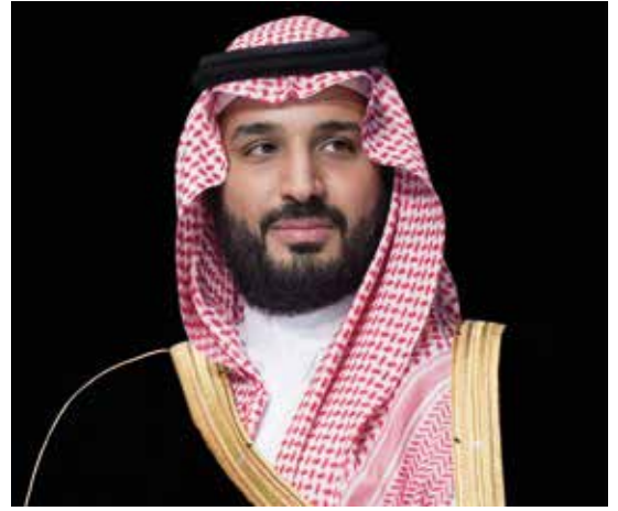
صاحب السمو الملكي الأمير

نحن نركز على تطوير القطاع غير الربحي، وأجزم أن معظم الشعب السعودي لديه الرغبة القوية في دعم القطاع غير الربحي لكنهم يتطلعون إلى البيئة المناسبة والتنظيمات والأنظمة التي تحمي أموالهم إذا حولوها إلى مؤسسات غير ربحية تضمن لهم العمل داخل وخارج السعودية بالشكل الجيد ونحن ننظر إلى القطاع غير الربحي بأنه قطاع مهم.