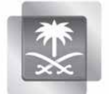
إذاعة نداء الإسلام