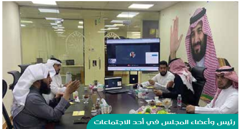
رئيس وأعضاء المجلس في أحد الاجتماعات