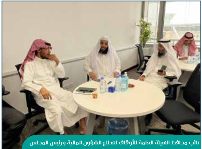
نائب محافظ الهيئة العامة للأوقاف لقطاع الشؤون المالية ورئيس المجلس