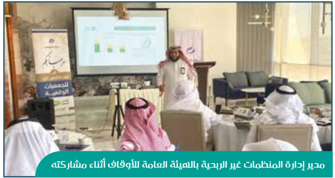
مدير إدارة المنظمات غير الربحية بالهيئة العامة للأوقاف أثناء مشاركته