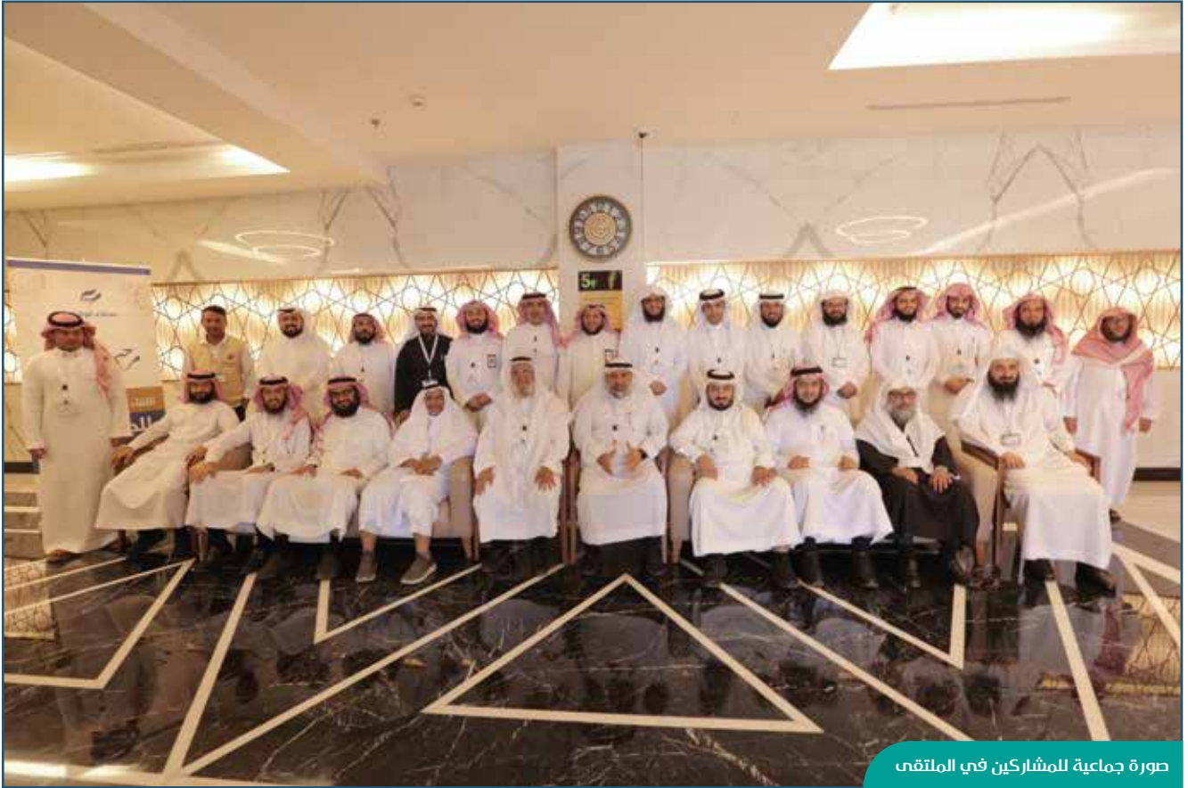
صورة جماعية للمشاركين في الملتقى

شاركت الجمعية في ملتقى الجمعيات الوقفية الأول الذي نظمته جمعية عطاء لخدمة القطاع الوقفي في منطقة عسير، بمدينة أبها بتاريخ 2022/10/27م، كما شاركت الجمعية في دورة الاستدامة المالية التي نفذت على هامش الملتقى.