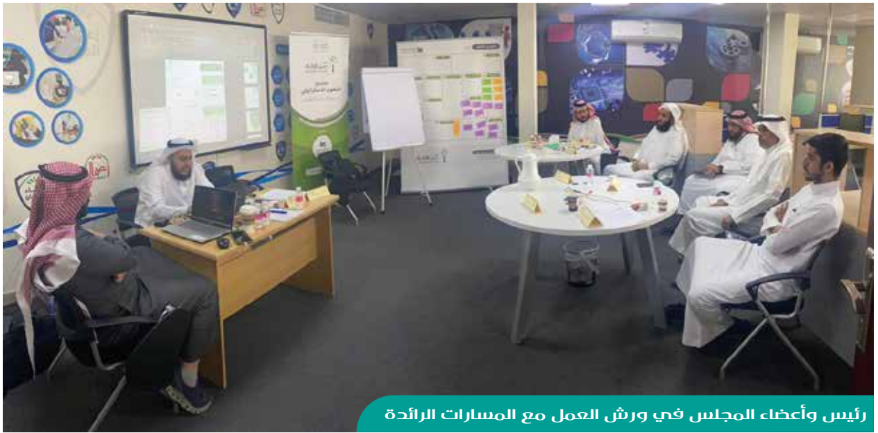
رئيس وأعضاء المجلس في ورش العمل مع المسارات الرائدة

استطاعت الجمعية - بفضل الله - الحصول على منحة من مؤسسة عبدالله بن إبراهيم السبيعي الخيرية لتمويل بناء وتطوير استراتيجيتها، وتم تكليف شركة المسارات الرائدة لبناء الاستراتيجية، ومن المتوقع أن يتم الانتهاء من الخطة منتصف عام 2023م بمشيئة الله.