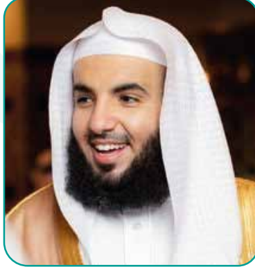
رئيس مجلس الإدارة راجس بن أحمد الشرافي