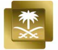
إذاعة القرآن الكريم