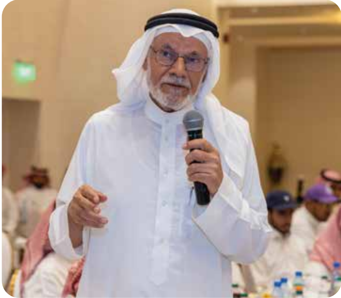
معالي وزير الشؤون الاجتماعية سابقاً الدكتور علي النملة خلال الإفطار الرمضاني